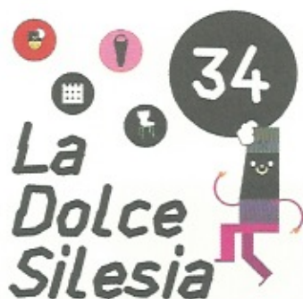
La Dolce Silesia Zamek Cieszyn ul. Zamkowa 3 8 sierpnia – 15 września