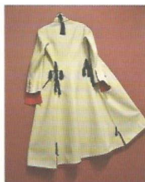
Ubranie. Ćwiczenia z architektury i anatomii Muzeum Etnograficzne w Krakowie Plac Wolnica 1 do 29 września

Pod hasłem tegorocznego festiwalu It's all about humanity kryją się trzy grupy zagadnień: spożywanie, zamieszkiwanie i empatia. Trzy główne wystawy to „Food | Design | Człowieczeństwo”, „Za-mieszkanie. Miasto ogrodów, miasto ogrodzeń”, nawiązująca do „Wystawy architektury i wnętrz w otoczeniu ogrodowym” z 1912 roku, oraz „DEEP NEED – empatia i projektowanie” (o której piszemy na str. 108). W programie ogłoszenie wyników cyklicznych konkursów: „make me!” dla młodych projektantów i „must have!” dla profesjonalistów. lodzdesign.com