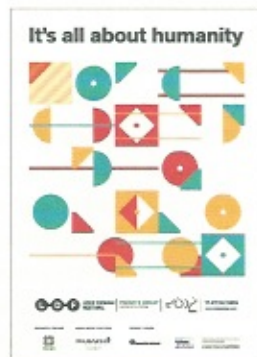
Łódź Design Festival Centrum Festiwalowe, ul. Targowa 35 17–27 października