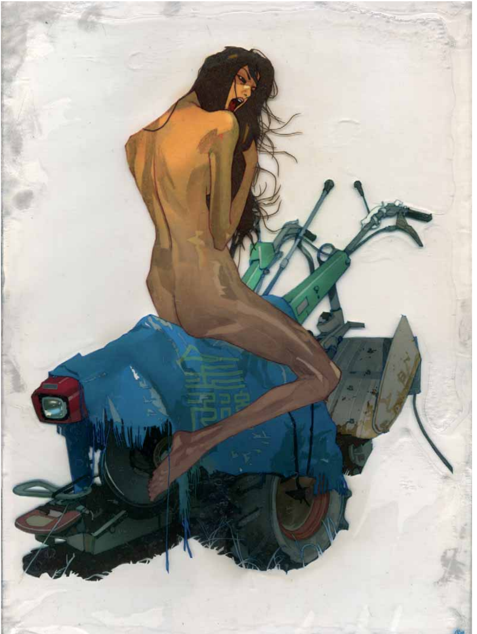
Edwin Ushiro, «After all the tears have rusted», 2007